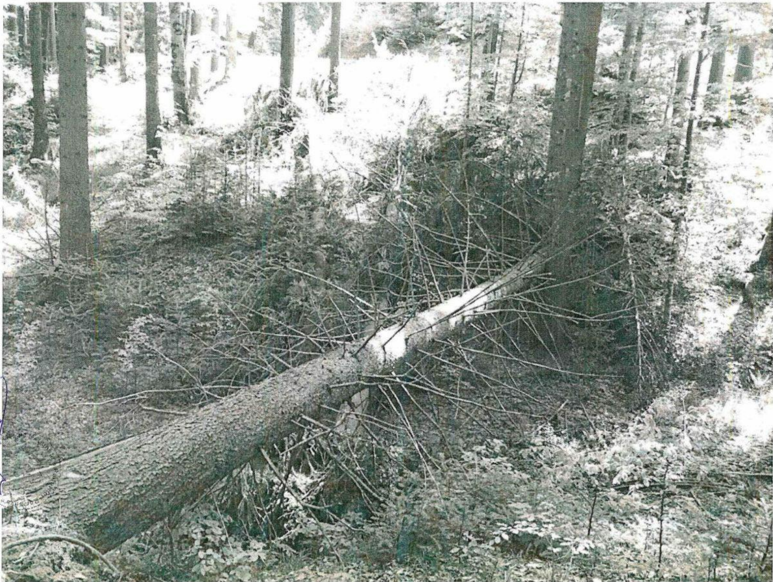
Patida nr. 4 Aei casele Binoxi

Handwritten signature or mark in the bottom left corner.