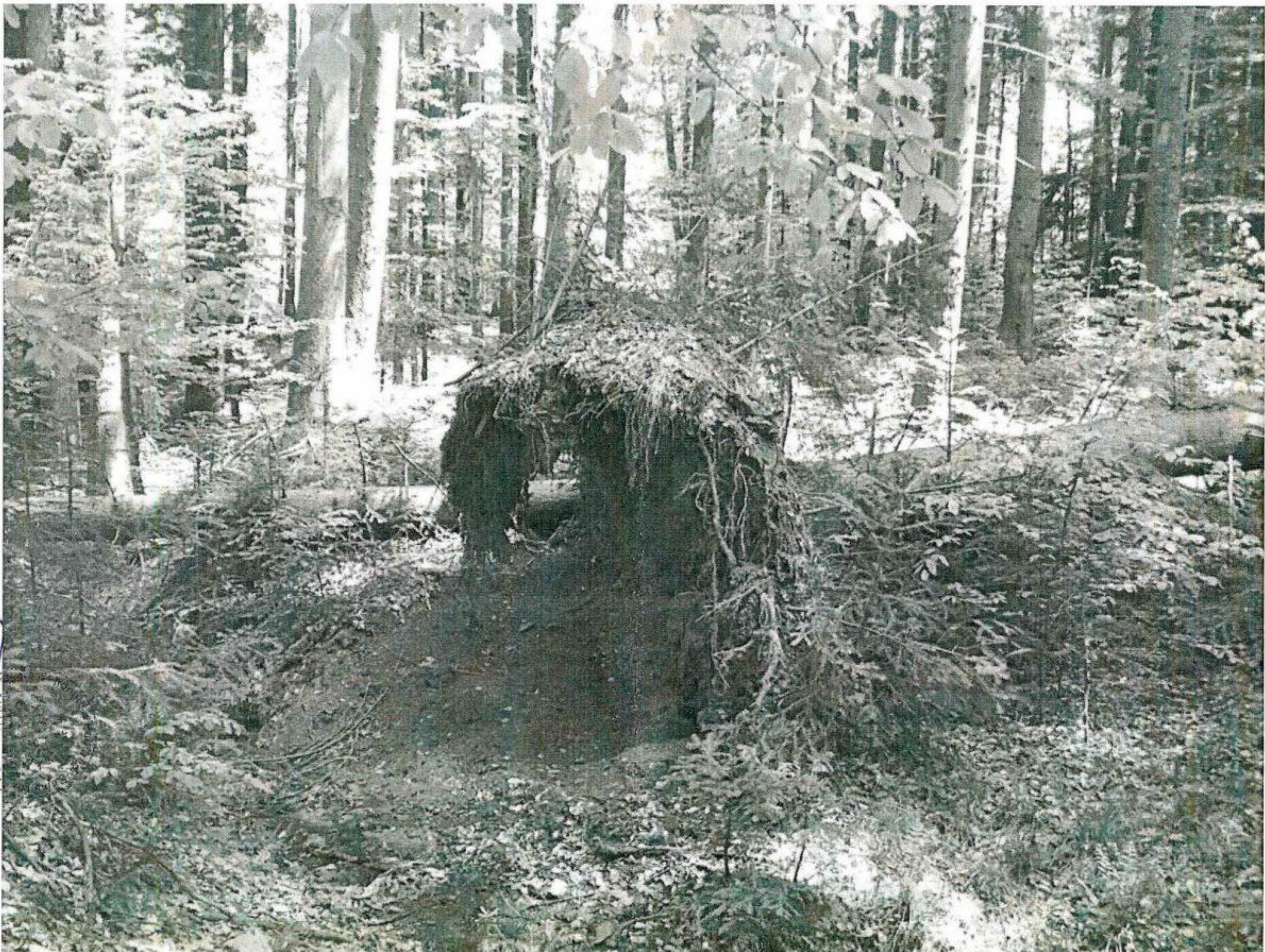
Partida mt. 4. Aci casele Binoai