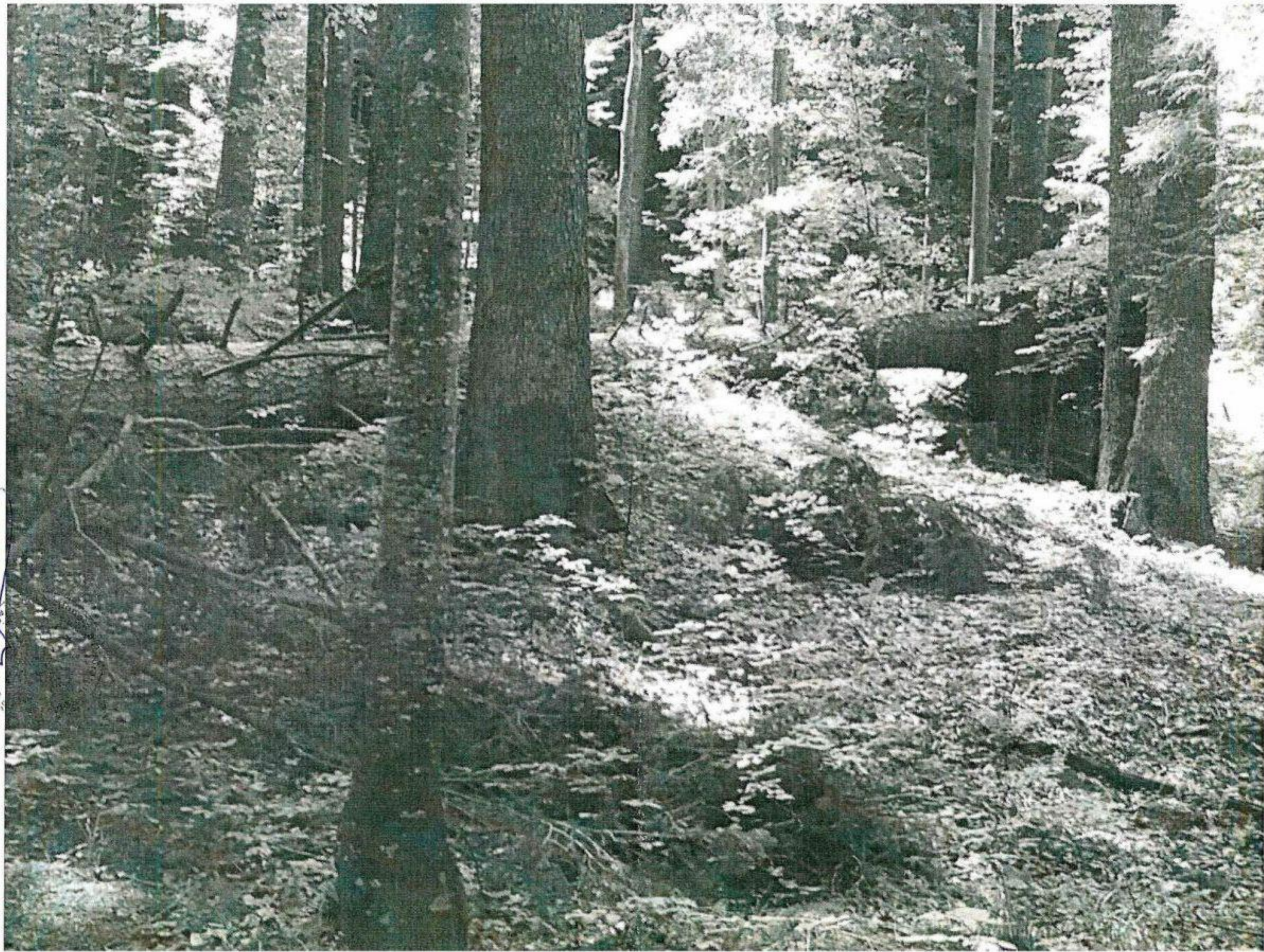
Partida nr. 4 Aci casele Binoșii